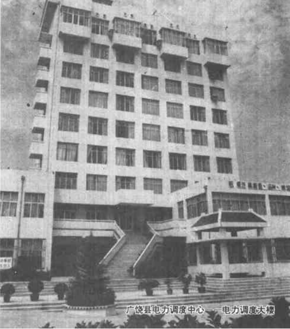
广饶县电力调度中心——电力调度大楼

加强电费管理,减轻农民负担。前几年,该镇曾不同程度地存在“人情电与搭车收费”现象,个别村电费电价高不下。电力法实施后该所依照电力法“禁止任何单