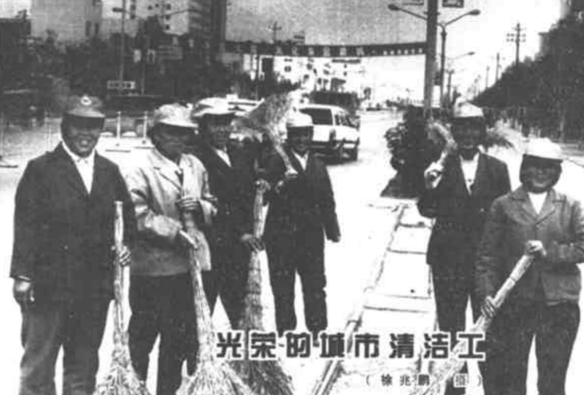
光荣的城市清洁工

城市在专业人员看来，是一个错综复杂的包容多种事业和专业特征的信息综合体，但在平常人看来，却大都是耳闻目睹和亲身感受到的直观性的东西。因而平常人看城市，有他自己的特点和角度。他不必用专业的眼光去分析城市中的某一事物，只须通过自己的方式来感受、来体会。所以，平常人看城市，看的无非就是“立着的楼房，躺着的路，四季鲜花常绿的树”。但平常人这简单的一看，却包含了对一个城市现代化水平综合感受和评价。因为城市总归是平常人的城市。 城市各项事业都是按照平常人的生产、生活环境需求加以建设和发展的，因此，城市建设的责任就是使每一个平常人爱看我们的城市，爱生活在我们的城市。城市现代化标准内容很多，但归结起来就是基础设施现代化、环境质量现代化、精神文明现代化。而这一切恰恰全部物化在平常人的一看之中。 东营市是我们生活在这里的每个人看着发展起来的，对看到的情景有深切的感受，这种变化是巨大的，有人说东营市已经从“没法看”发展到了“可以看一看”，我们为此已付出十几年的努力。如果我们真正把我们的城市建设得每个人都：“很好看”，还需要更多的付出和代价。这说明，我们还没有真正过“看”这一关。当然，城市是要平常人来生活、来看的，但我们的城市更需要千千万万平常人的爱护，只生活和只看而不爱护，城市也就没法看了。 城市建设融汇着每个平常人的事业，也融汇着每个平常人不平常的业绩，我们应该为了城市能让所有平常人爱看而做出我们的努力。因为，如果每一个人都愿意到这里看一看，那么，他难道不为看到我们每一个平常人不平常的业绩而激动吗？（宋守军）